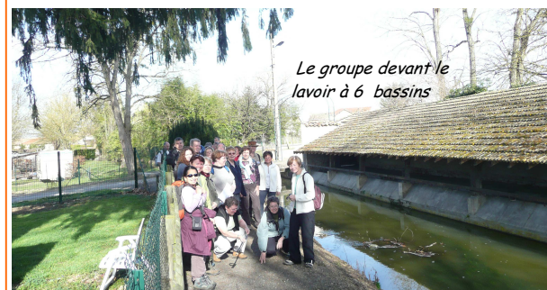
Le groupe devant le lavoir à 6 bassins

Le dimanche 3 mars 2008, soleil généreux et douceur printanière pour randonner sur ce circuit des moulins de la Chalaronne. Ils étaient 13 moulins en l'an de grâce 956 le long des 5,5 km du canal des Echudes creusé à mains d'hommes, parallèlement à la Chalaronne. Nous, nous étions 26 à les chercher... nous les avons « devinés » plus que « trouvés » mais